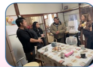
にっけい じんたく ほうもん 日系ペルー人宅を訪問

日系ペルー人も参加して、祖先の沖縄のビデオを見て感激していました。参加者も昔移民した日本人のルーツを知り、改めて100年の歩みを知りました。