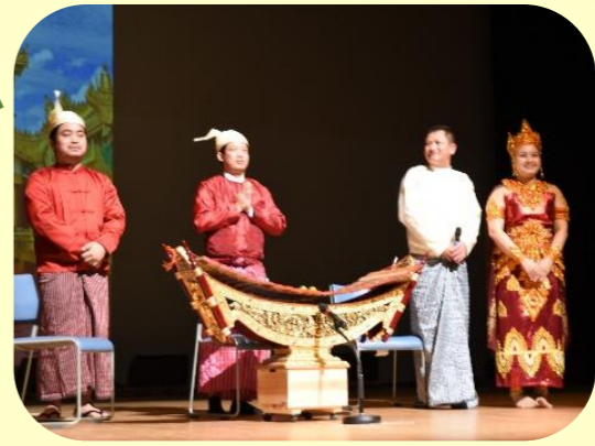
ミャンマーの踊りと演奏

外国の文化、歴史、踊りや遊び、また日本のお茶やゆかたを着る体験など盛りだくさんのフェスティバルです。皆さん遊びに来てください。