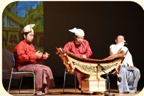
ミャンマーの楽器演奏