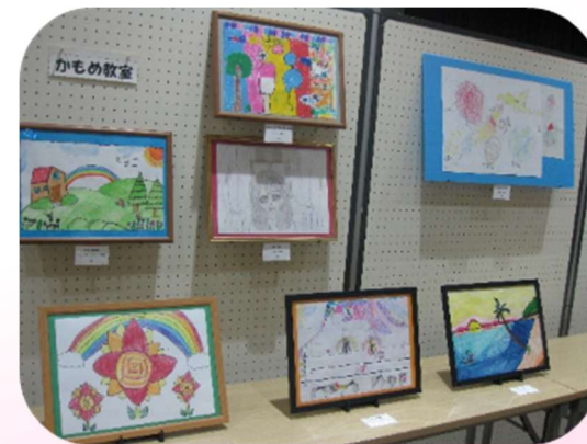
しょうがく ねん わんせいさくひん 小学1年～5年生作品

9月30日～10月4日の5日間、金沢公会堂多目的室で「カナカツびじゅつてん ひら まいとし美術展」が開かれました。毎年かもめ教室の子どもたちの絵も出展しています。のびのびとした夢のある絵や心の中を写したようなドキッとさせる絵、子どもたちの流行の絵など、子どもの世界をのぞくような体験になりました。