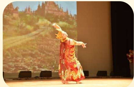
ミャンマーのおどり

11月30日に金沢公会堂で金沢国際交流ラウンジフェスティバルが開催されました。外国人による日本語でのスピーチや日本、ミャンマーの伝統芸能などいろいろな発表がありました。体験コーナーではピニャータや折り紙、書はがき、紙相撲など盛りだくさんでした。文化を伝えることの大切さを学び、とても有意義な時間となりました。