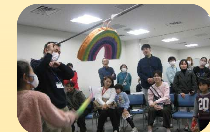
ピニャータうまくわれるかな

ふれあいの広場では、折り紙・紙相撲・射的・書はがきの体験コーナー、中南米の遊び ピニャータがありました。折り紙でサンタクロースとクリスマスリースを作ったり、紙のお相撲さんに色を塗ったり、2人で相撲対戦を楽しみました。射的では、割り箸鉄砲でねらいを定めて的に当てることを楽しみました。