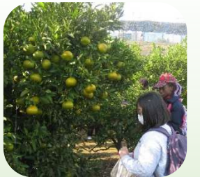
どの木にしようか

終わった後、柴漁港に行き、海からとってきたばかりの生きた魚を見せてもらいました。子どもも大人も、大きな魚を見てびっくりし、とてもうれしそうでした。