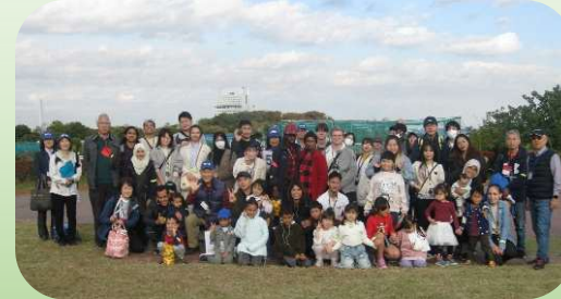
みかん たくさんとれたよ

11月16日(日)外国人の散歩ツアー「みかんがりへいこう」が行われました。今年は13の国から47名が参加しました。柴ファームでは、おいしいみかんをたくさん食べ、お土産も袋に詰めて持って帰りました。