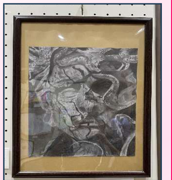
しょうがく ねんせいさくひん 小学6年生作品