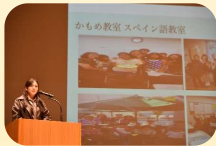
将来に向けて 大学生の発表

ステージでは日本やミャンマー、インドネシアなど、さまざまな国の文化に直接触れられる演目があり、迫力のある舞台を間近で感じることができました。日本語の発表では、国のことや日本で生活して感じていることを知ることができました。