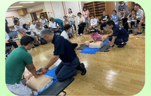
いのち まも くんれん 命を守る訓練

9月20日のフリーダムサロンは「防災」がテーマでした。金沢消防署から2名の消防士が来て、まずビデオを見て、倒れた人へどうしたらよいかを考えました。次に心臓マッサージ、AEDの使い方を人形を使って学び、救急車を呼ぶ電話のかけ方を習いました。外国人参加者は、今後役に立つよい経験だったと話していました。