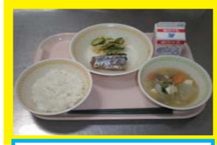
<<메뉴의 예>> 밥, 돼지고기장국, 생선조림, 즉석절임, 우유

A '편식이 있다, 먹는 속도가 느리다, 음식 알레르기가 있다...'등, 우려의 소리를 많이 듣습니다만, 학교에서는 아이들이 즐겁고 맛있게 급식을 먹을 수 있도록 다양한 연구를 하고 있습니다.1학년 초기에는 먹는 시간과 양에 개인차를 보이는데, 아이가 먹을 수 있는 양을 배려해서 익숙해질 때까지 상차림, 식사, 정리 등을 포함한 급식 시간을 다른 학년 학생들보다 여유있게 책정하고 있습니다.음식 알레르기 대응(제거식 등)에 대해서는 취학시의 건강진단이나 입학설명회 등에서 입학전에 학교측과 상담해 주십시오. 가정에서는 다양한 음식 재료에 익숙해져서 아이가 함께 식사하는 즐거움을 느낄 수 도록 도와 줍시다.