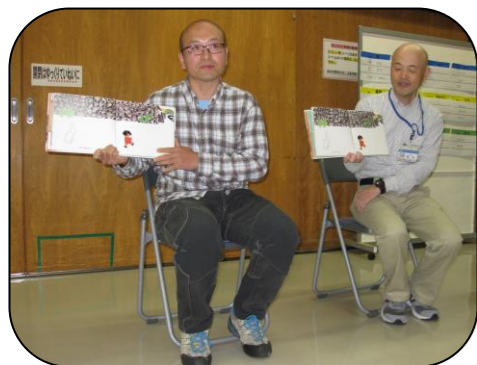
韓国語と日本語で読む

会場は子どもも含めて50名くらいでした。皆熱心に聞き、その後は会場内に並べられた各国の本を見て楽しみました。