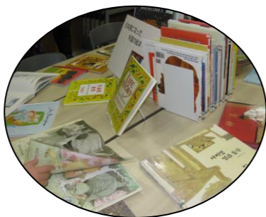
各国語の本・訳された本