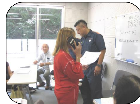
ここは・・・番地です