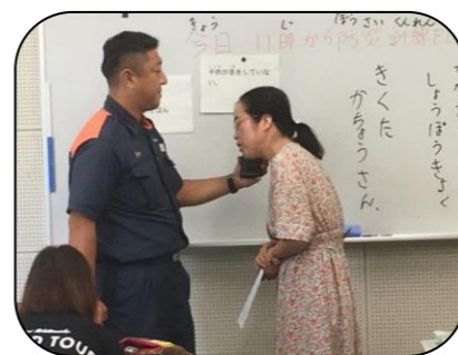
もしもし 家がもえています

さらに119番へ電話をする方法を学び、実際に学習者2人が119番指令室に訓練で電話をすることも行いました。緊急電話の訓練をした外国人は、住所を伝えるのが難しいようでした。学習者からは消防署の方は大きな声で動きを交えてわかりやすい説明でよかったとの感想がありました。