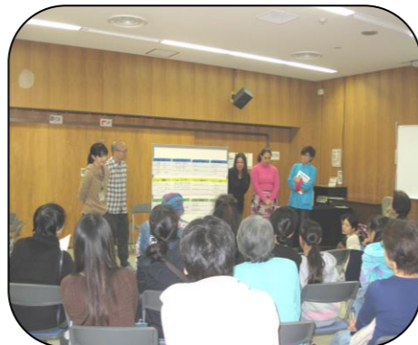
クイズ 4カ国語で答え