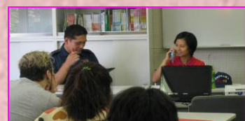
金沢消防署員と模擬電話を使っ て119番通報中!