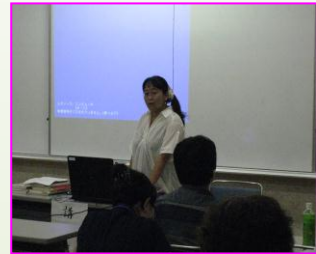
10月2日第五回 (写真は仮のもの)