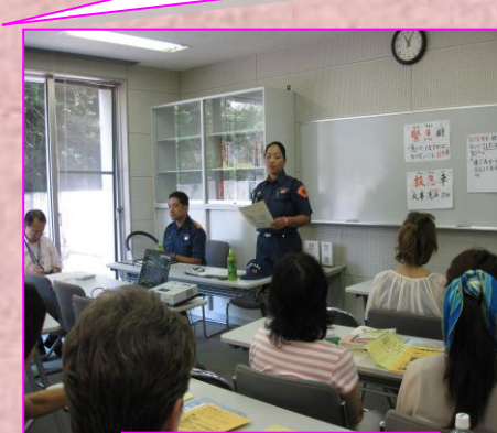
金沢消防署員による 119番通報の説明

外国人Cさん:会社の電話も災害用伝言ダイヤル171に登録できることがわかり安心した。