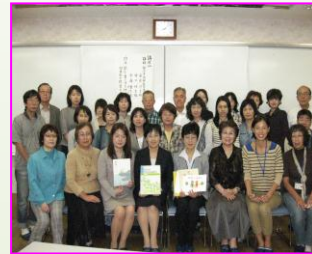
講師の先生と運営ス タッフで記念撮影