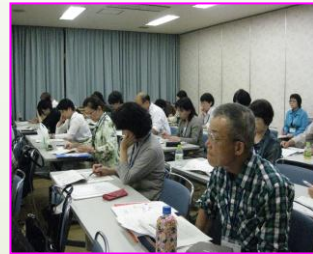
講師の話に聞き入る 受講生