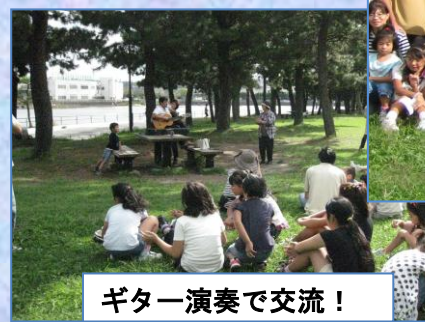
ギター演奏で交流!