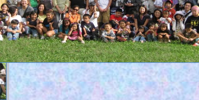
ゲームで国際交流!