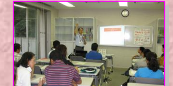
部員による171の説明