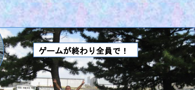
ゲームが終わり全員で!