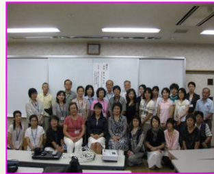
講師と受講生で 記念撮影