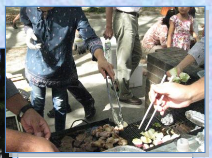
バーベキュー進行中!